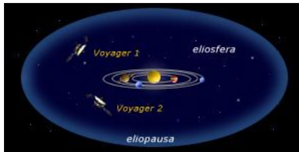
Situazione al 16 novembre 2001

Fra i risultati ottenuti una immensa mole di immagini dei 4 grandi pianeti gioviani e delle loro lune, nonché dati sui loro parametri fisici e chimici, sulla composizione delle loro atmosfere, sul vento solare e sui raggi cosmici, che hanno rivoluzionato completamente l'astronomia con nuove rivelazioni sull'origine del sistema solare. Attualmente, dopo 25 anni dalla partenza ed oltre una decina di miliardi di km percorsi, ambedue le navicelle viaggiano con orbite differenti ed inclinate, rispetto al piano dell'eclittica, di 35^\circ , la Voyager 1 (attualmente il più distante manufatto umano) in direzione Nord verso l'apice solare (quel punto della galassia ove converge il Sole rispetto alle stelle vicine), e di 48^\circ , nella direzione opposta, la Voyager 2. La loro velocità annua ammonta rispettivamente a 3,6 UA per la prima e a 3,3 UA per l'altra.