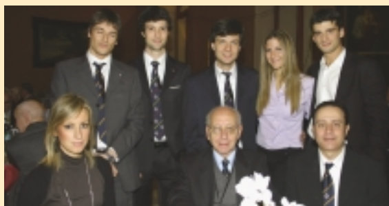
Cena di Natale