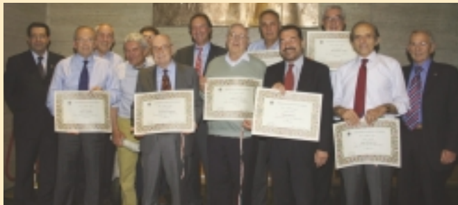
"Maturati del 1957"