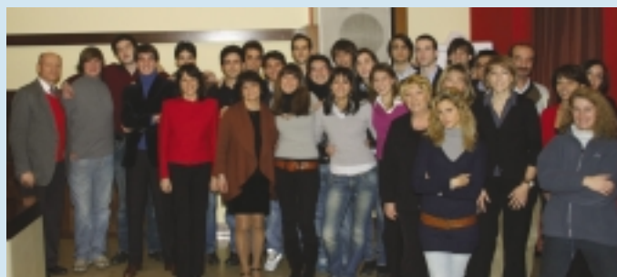
"Maturati del 2007"