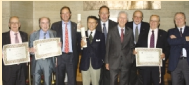
"Maturati del 1957"