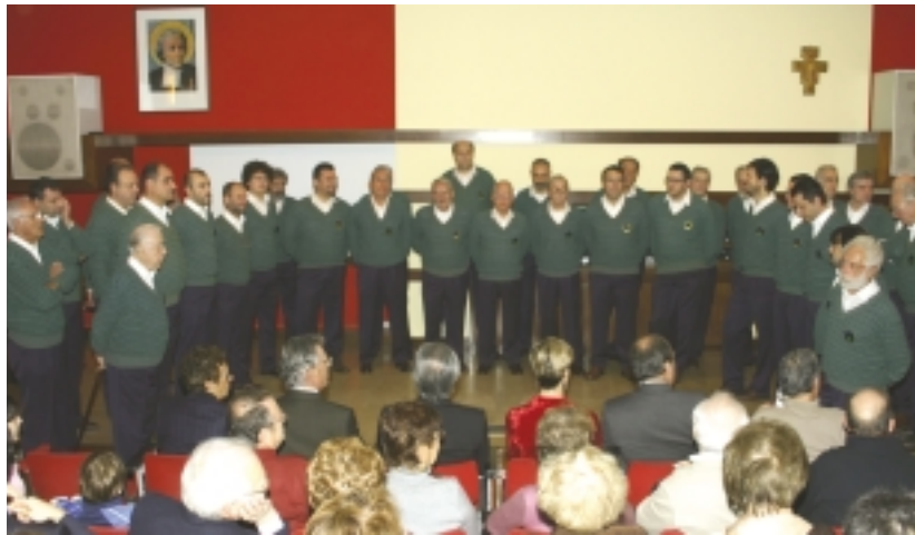
Il Coro A.N.A.

3) Nella notte Natal in dialetto lombardo per la notte di Natale che termina con la simpatica constatazione che al Bambino Gesù che "l'è biot e disquatà c'è chi "con la piva e 'l pasturel fan la nenia al Bambinel".